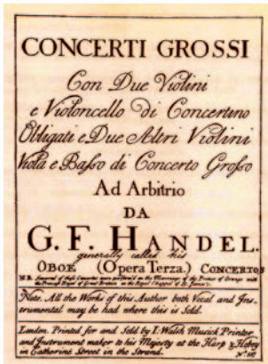
Page de titre de l'édition de John Walsh des Concerti grossi opus 3 de Haendel, (Londres 1734).