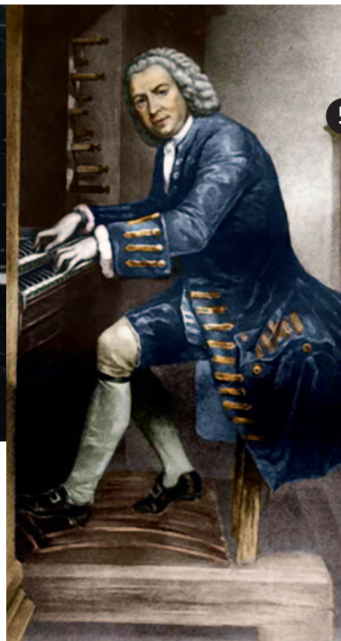
Johann Sebastian Bach, par Edouard Hamman.

► Entrée libre dans la limite des places assises disponibles. Réservations sur le site du festival : festivallaviamusica.com En partenariat avec le CRR du Grand Besançon Métropole