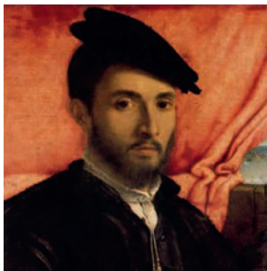
Pedro de Escobar (1465-1535)