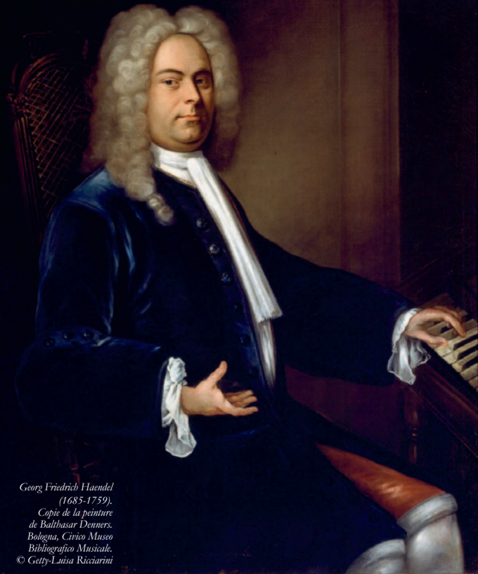
Georg Friedrich Haendel (1685-1759). Copie de la peinture de Balthasar Denner. Bologna, Civico Museo Bibliografico Musicale.

10 20h / Besançon Théâtre Claude-Nicolas Ledoux ■ Händel, génie de la voix ! Arias, Concerti Grossi et Cantates